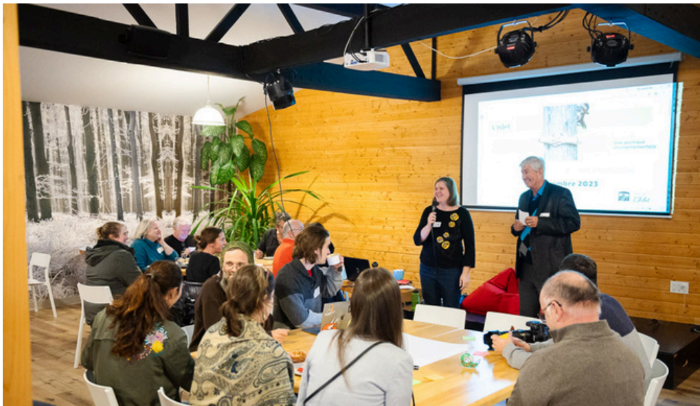
La soirée de consultation du 8 novembre 2023 à L'Islet