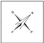
Schéma révisé de couverture de risques en sécurité incendie Réseau d'aqueduc municipal de Sainte-Louise Carte 4-6