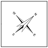
Schéma révisé de couverture de risques en sécurité incendie Réseau d'aqueduc municipal de Saint-Pamphile Carte 4-1