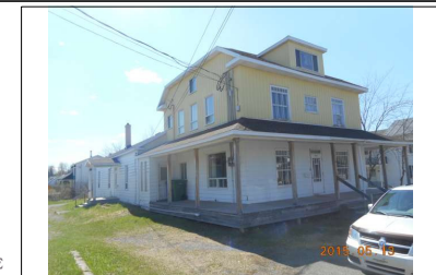
Échelle : 1:1227